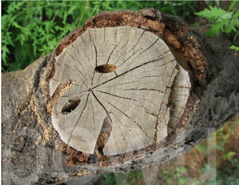
Abb 3 Schadbild

http://tupian.hudong.com/s/%E6%A1%83%E7%BA%A2%E9%A2%88%E5%A4%A9%E7%89%9B/xqtupian/1/6