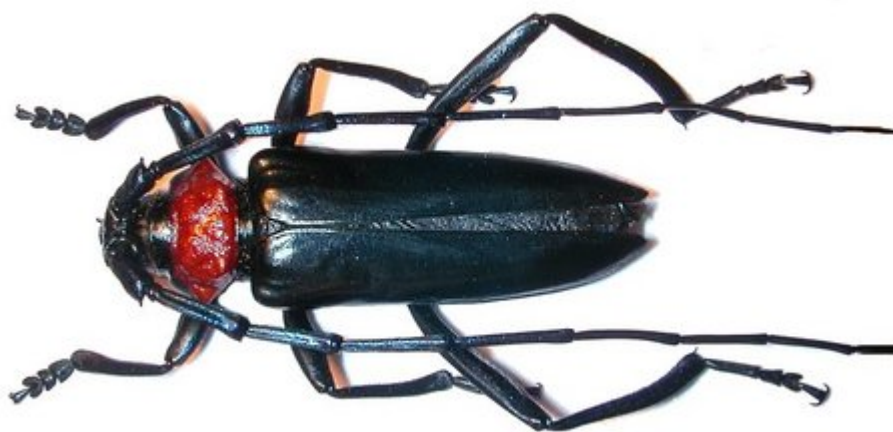
Abb 2: Imago. http://pest.ceris.purdue.edu/pest.php?code=INALFJA

http://tupian.hudong.com/a3_26_82_01300000085669121076821044108_jpg.html